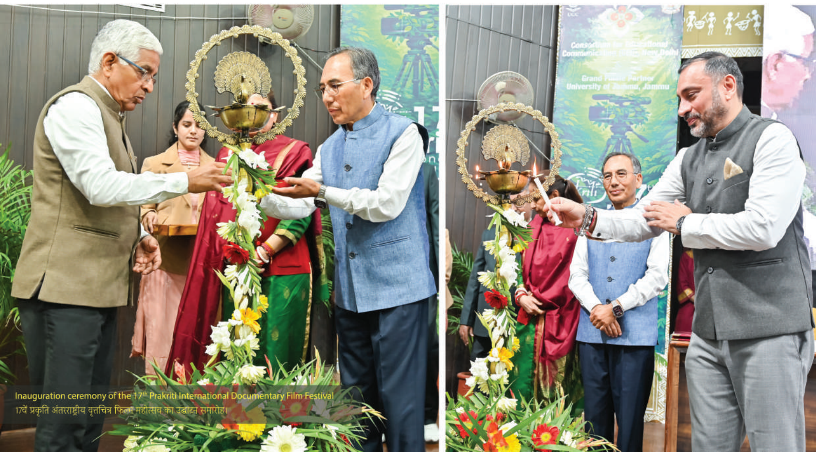
Inauguration ceremony of the 17 th Prakriti International Documentary Film Festival 17वें प्रकृति अंतरराष्ट्रीय वृत्तचित्र फिल्म महोत्सव का उद्घाटन समारोह।

वर्ष 1997 से सीईसी की प्रमुख वार्षिक पहलों में से एक 'प्रकृति' महोत्सव वृत्तचित्र सिनेमा को जागरूकता एवं संवाद के माध्यम के रूप में प्रोत्साहित करता रहा है। वर्ष 2018 से प्रतिस्पर्धात्मक प्रारूप अपनाने के बाद महोत्सव ने दक्षिण-पूर्व एशियाई देशों तक पहुंच का विस्तार किया तथा 'पर्यावरण', 'विकास' और 'मानवाधिकार' के साथ 'स्वच्छ भारत' को भी अतिरिक्त श्रेणी के रूप में सम्मिलित किया।