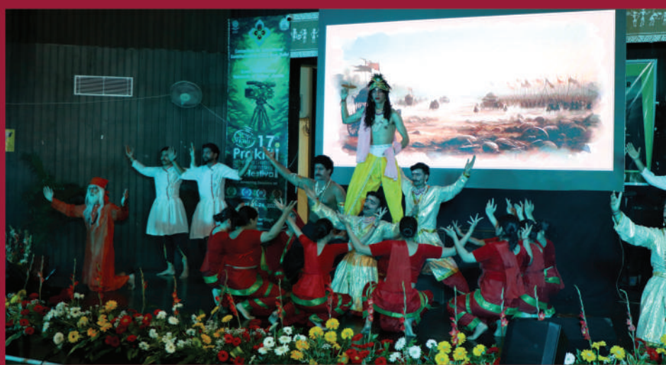
Glimpses from the 17 th Prakriti International Documentary Film Festival at the University of Jammu