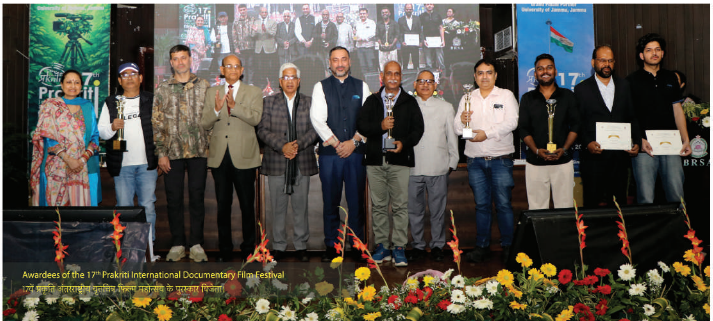
Awardees of the 17 th Prakriti International Documentary Film Festival

The Prakriti International Documentary Film Festival, one of CEC's flagship annual initiatives since 1997, serves as a platform to promote documentary cinema as a medium of awareness and dialogue. Over the years, the festival has travelled across various cities in India, bringing together filmmakers, students, academics, administrators, development professionals, and media representatives. Since adopting a competitive format in 2018, the festival has expanded its reach to include participation from Southeast Asian countries and added 'Swachh Bharat' as an additional category, alongside 'Environment', 'Development' and 'Human Rights'.