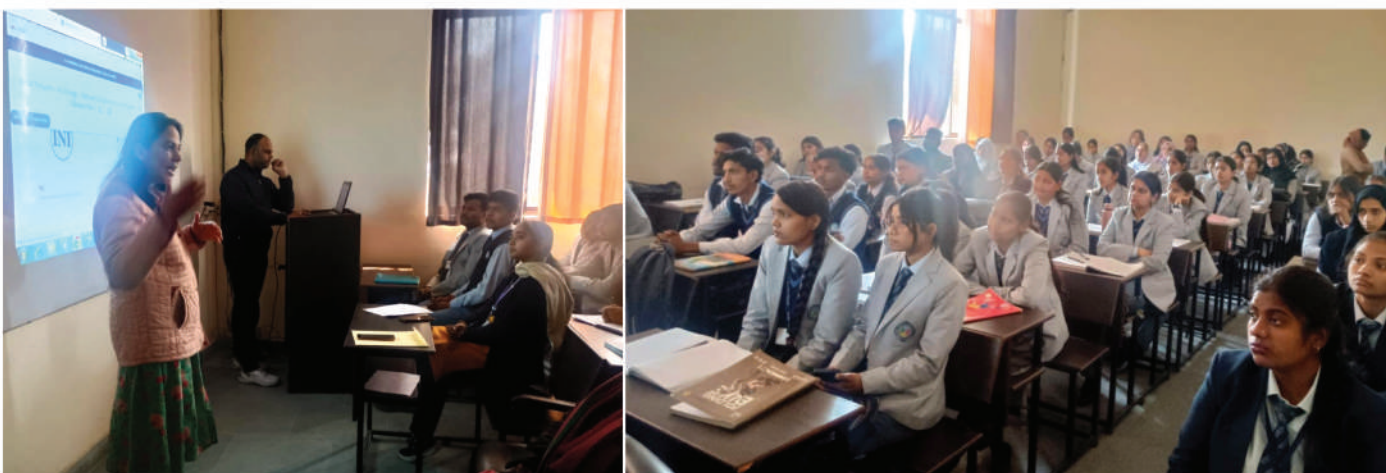
EMRC Roorkee organises CEC-MOOCs awareness workshop at Motherhood University, Roorkee